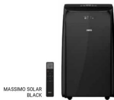
MASSIMO SOLAR BLACK