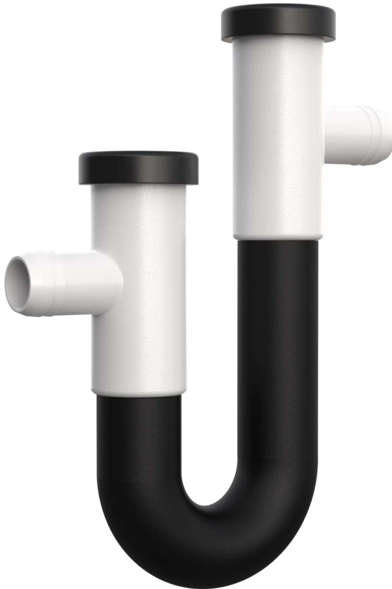
Сифон для сбора конденсата G-34